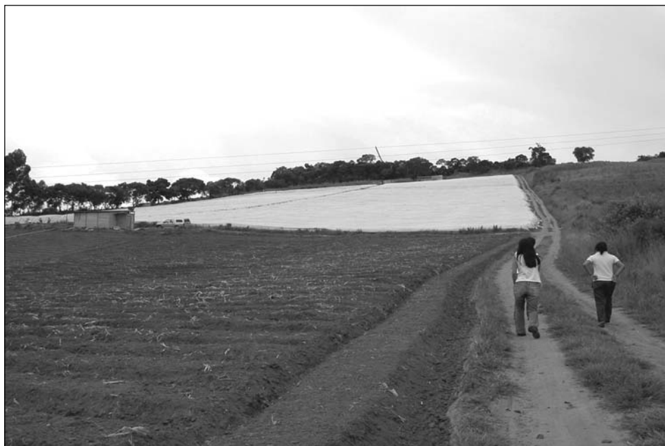
Figura 4 – Composição paisagística do cultivo do morango com a cobertura plástica exigida para proteção de intempéries climáticas

A batata, o milho e o morango são culturas temporárias que alteram sazonal e profundamente a paisagem da região (Figuras 4 e 5). A rotatividade de produção agrícola com alternância de culturas diferentes é exigida pelo manejo necessário do solo e também pela rápida sazonalidade da cultura da batata e do morango. Esta dinâmica de alternância de culturas modifica cíclica e continuamente os elementos componentes da paisagem, redefinindo os seus limites e promovendo a evolução da fragmentação do mosaico paisagístico da região.