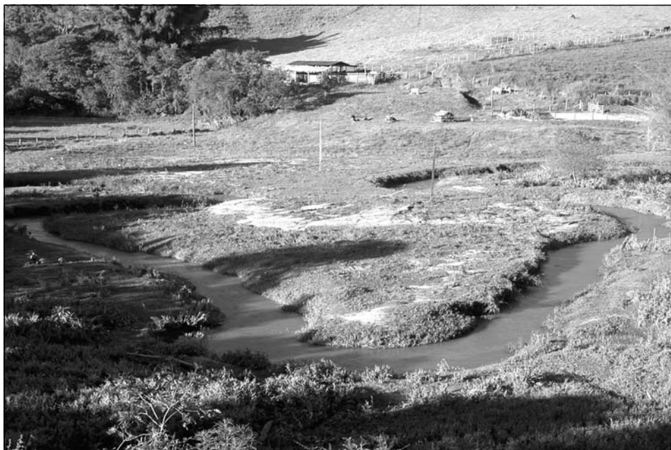
Figura 6 – Ausência da mata ciliar e assoreamento do corpo d'água