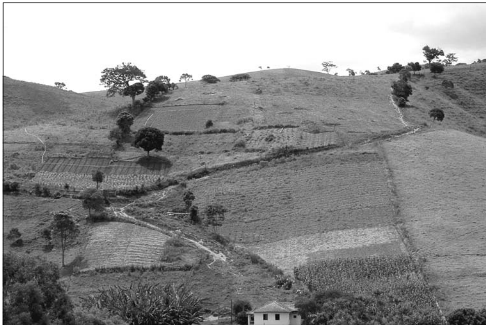
Figura 3 – Mosaico de componentes da paisagem em Bom Reposo – MG