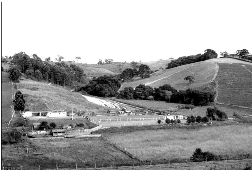
Figura 2 – Paisagem Fragmentada da região de Bom Repouso – MG

Como decorrência da intensa atividade humana na região, a paisagem de floresta primária encontra-se reduzida a fragmentos que sobrevivem rodeados pela monocultura de batata e de morango, cultivadas em escala comercial e em alguns espaços pela pastagem de gado, compondo unidades elementares diversificadas que contribuem para a formação do típico mosaico paisagístico da região (Figuras 2 e 3).